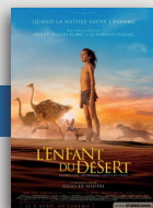
L'ENFANT DU DÉSERT