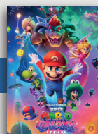
SUPER MARIO GALAXY