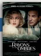
LES RAYONS ET LES OMBRES