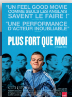
PLUS FORT QUE MOI