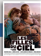
LES FILLES DU CIEL