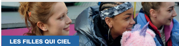
LES FILLES DU CIEL

Héloïse n'a nulle part où aller. Elle fait la rencontre de Mallorie qui lui propose de l'héberger dans l'appartement qu'elle partage avec deux autres jeunes femmes. Héloïse va trouver là un nouveau foyer et une nouvelle famille. Mais leurs blessures passées menacent l'équilibre fragile entre ces femmes en apparence si solides.